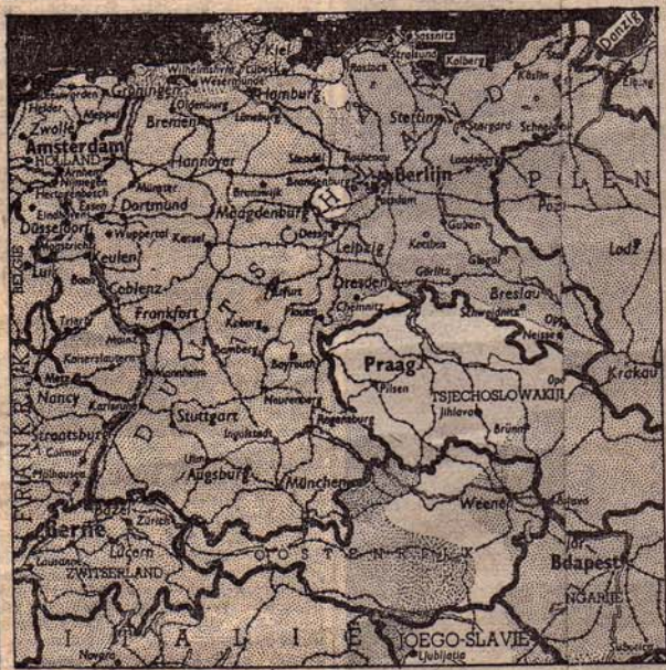
De laatste resten van het Derde Rijk, Zondagavond 6 M (Observer).

De geheele plechtigheid heeft vijf minuten geduurd. In miljoen Duitschers hebben zich onvoorwaardelijk overgegeven.