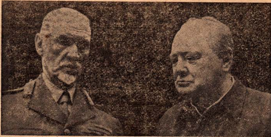
Generaal Smuts tijdens zijn verblijf in Engeland op bezoek bij Churchill.